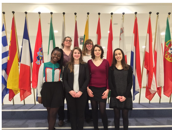
La promotion 2015-2016 de la CJDE

Chaque année, les étudiants souhaitant s'investir dans la CJDE sont sélectionnés (6 places environ) et travaillent avec notre partenaire durant 6 mois (entre janvier et juin).